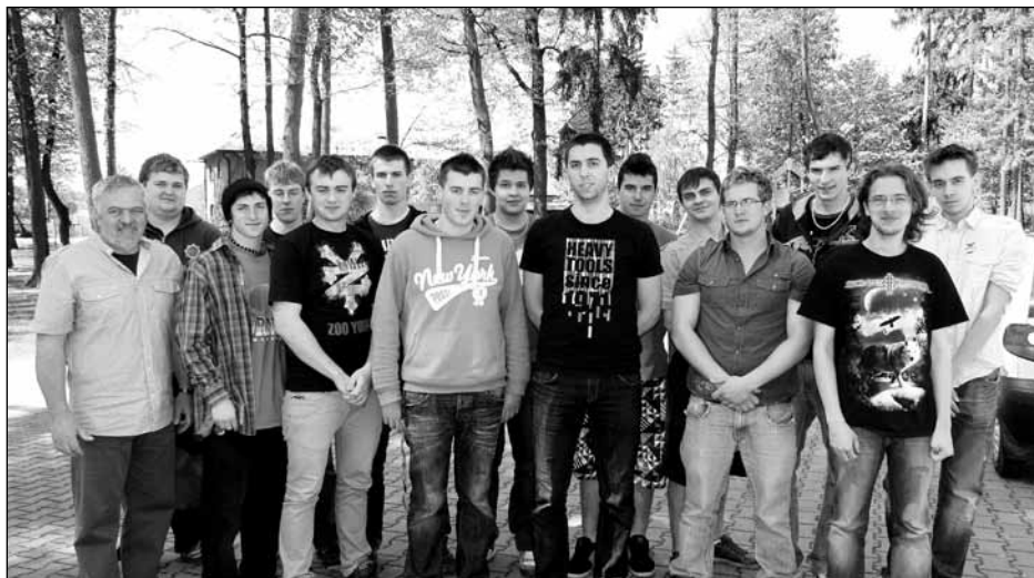
Třída 4. ME