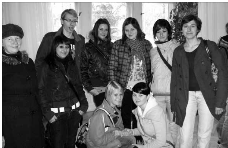
Žákyně na odborné stáži v polském Dzierzoniowě