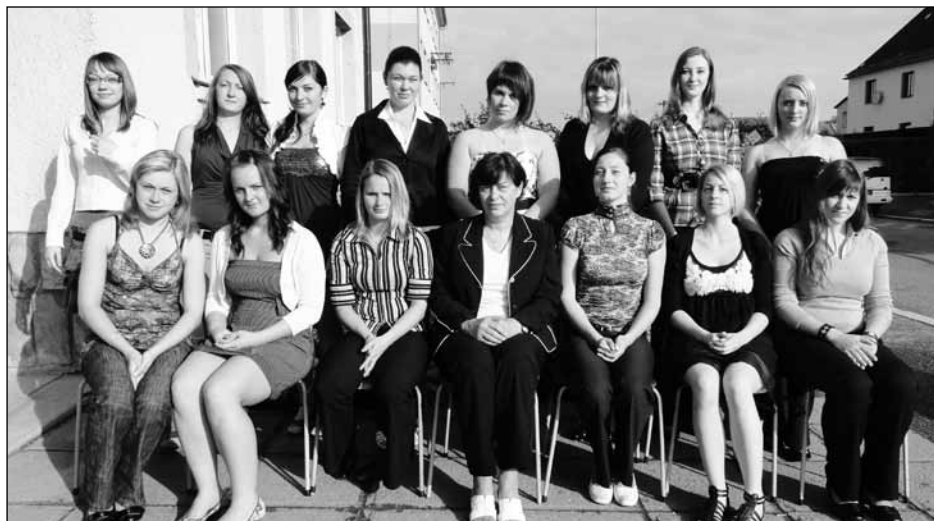
Třída 4. KM