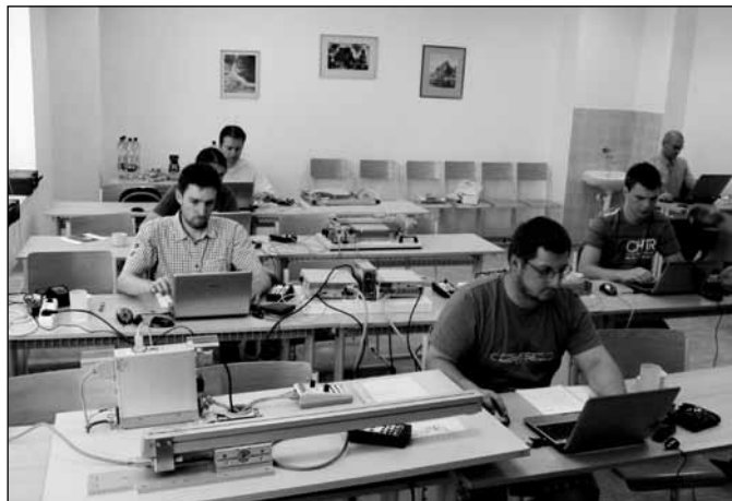
Pohled na účastníky semináře