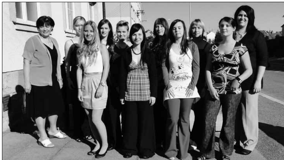
Třída 4. KO