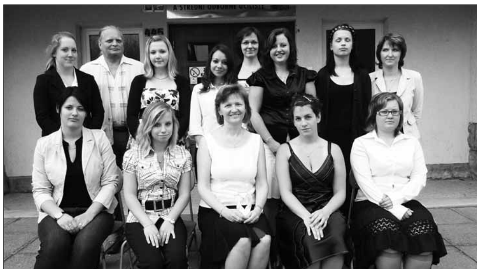
Třída 3. KN