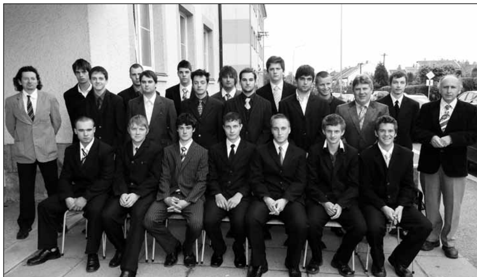
Třída 3. NS