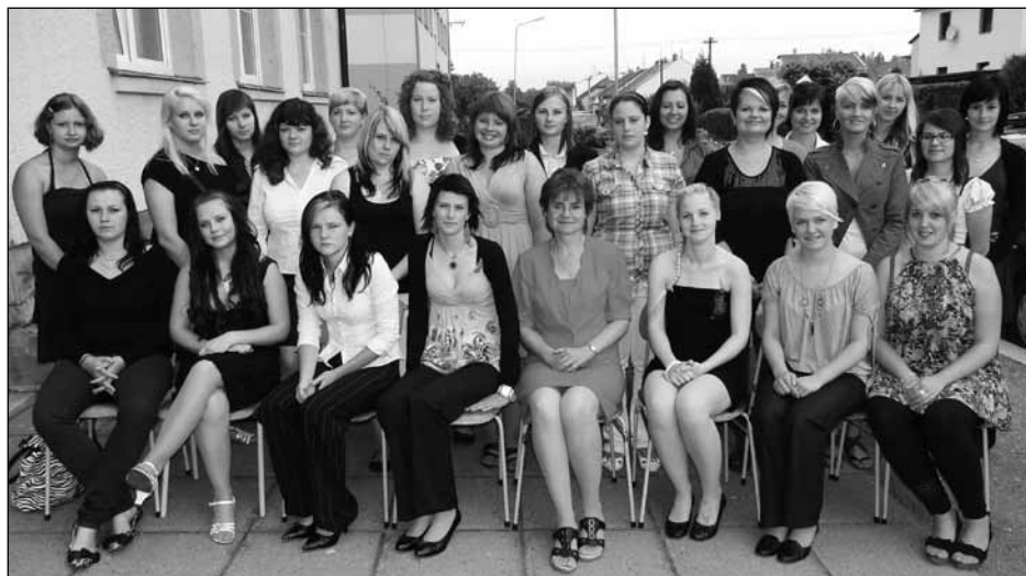
Třída 3. KA